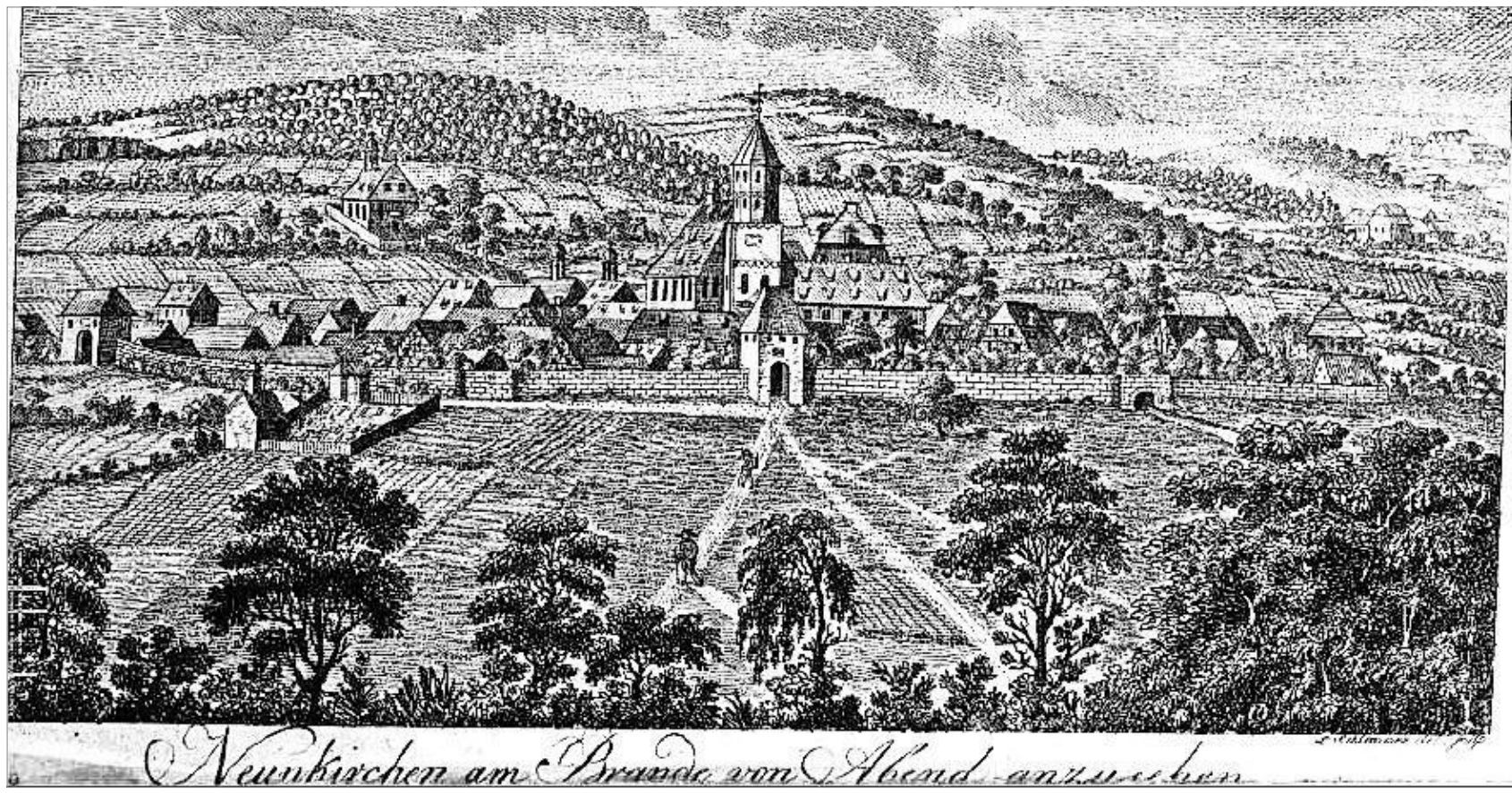
Das historische Bild zeigt die Gemeinde Neunkirchen am Brand im Jahr 1814 mit den damals ortstypischen Obstplantagen.

Die Grundlage für eine eigenverantwortliche Entwicklung der Ortschaften legte das bayerische Gemeindeedikt vom 17. Mai im Verfassungsjahr 1818. Der bayerische König erläuterte gleich zu Beginn seines Erlasses: „Wir haben, in Folge früherer Einleitungen