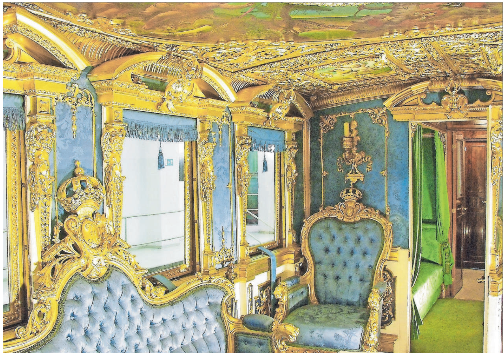
Neuschwanstein auf Rädern. Mit diesem Salonwagen der bayerischen Eisenbahnen ließ sich König Ludwig II. durch sein Bayern fahren und machte auch in Franken Station. Zwei im Original erhaltene Wagen sind im DB Museum in Nürnberg zu bestaunen.

Für die Bilanz fränkisch-bayerischer Koexistenz in der Monarchie bis zur Revolution im November 1918 war von Anfang an das Bild eines wittelsbachisch geprägten Landes entscheidend. Die Meinungen über die Wittelsbacher, die im alten Bayern seit Jahrhunderten – genauer gesagt seit 1180 – regierten, gingen in Franken weit auseinander. Das jeweilige Stimmungsbild wurde von inner- wie interterritorialen Erfahrungen vor 1806 geprägt. Ausschlaggebend für negative Erfahrungen konnten beispielsweise sein der Verlust alter Reichsfreiheiten (Wien war weiter entfernt als München!), konfessionsgebundene Vorbehalte, republikanisch-reichsstädtische Traditionen, eine verlorene Zentralität ehemaliger Residenzen, Amtssitze, Städte, Märkte sowie traumatisierende Schicksale nach der Säkularisation und Mediatisierung. Zur bitteren Verlustbilanz zählte ins-