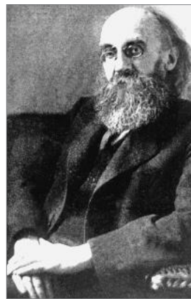
Kurt Eisner rief 1918 den Freistaat Bayern aus.

In Ellingen am ehemaligen Sitz der Deutschorde nördlich von Würzburg zog zwar kein leiblicher Wittelsbacher in die groß dimensionierte Schlossanlage, aber der König verlieh diesen Besitz als Thronlehen an den verdienten bayerischen Feldmarschall Karl Philipp Wrede (1767–1838), einem der wichtigsten Berater des bayerischen Königshauses. Neben den Königsschlössern war es die Tradition des Reisekönigtums, die Bayern zusammenwachsen ließ. Dies galt vor allem für Ludwig I., aber auch für Ludwig II., der sich in einem Salonwagen der bayerischen Eisenbahnen unmittelbar nach dem deutsch-deutschen Krieg Ende des Jahres 1866 mobil und präsent zeigte. Dieser „Triumphzug“ eines zwanzigjährigen Wittelsbachers führte sogar bis zu den Kriegsschauplätzen bei Würzburg – man sollte sie nicht „Schlachtfelder“ bezeichnen –, förderte in Franken entlang der Eisenbahn bayerischen Patriotismus und limitierte preußische Sympathiekundgebungen.