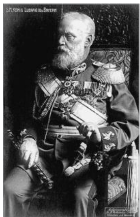
Ludwig III. war der letzte bayerische König.

Kurt Eisner rief – gut ein Jahrhundert später – am 7. November 1918 während der Novemberrevolution den Freistaat Bayern aus, ließ sich von den Arbeiter- und Soldatenräten zum ersten Ministerpräsidenten wählen und erklärte zuvor als Sozialist den letzten bayerischen König Ludwig III. für abgesetzt. Damit endete die 738 Jahre währende Herrschaft des Hauses Wittelsbach doch ziemlich abrupt, denn Ludwig III. war der erste deutsche Monarch gewesen, dessen Thron einer blutigen Revolution zum Opfer fiel.