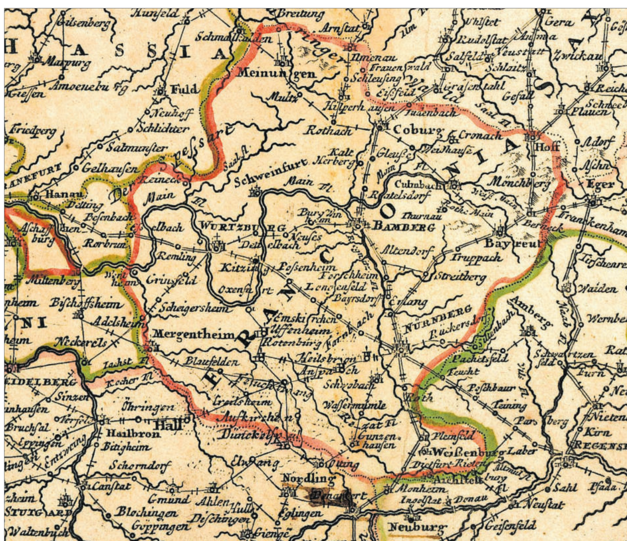
Diese historische Karte zeigt den Umriss des Fränkischen Reichskreises. Seit 2006 wird am „Tag der Franken“ an die Existenz des Reichskreises erinnert. In diesem Jahr findet der Festtag wieder in Mittelfranken statt, und zwar am 1. Juli in Ansbach. Im Mittelpunkt steht das gewiss reichhaltige Thema „Essen in Franken“.

tischen Wurzeln Frankens und anderer deutscher Regionen zu suchen.